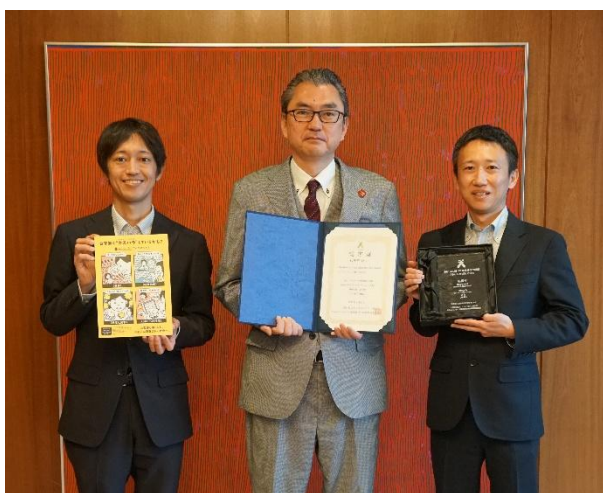
図1 札幌市にて実施されたトロフィー及び認定証贈呈式の模様